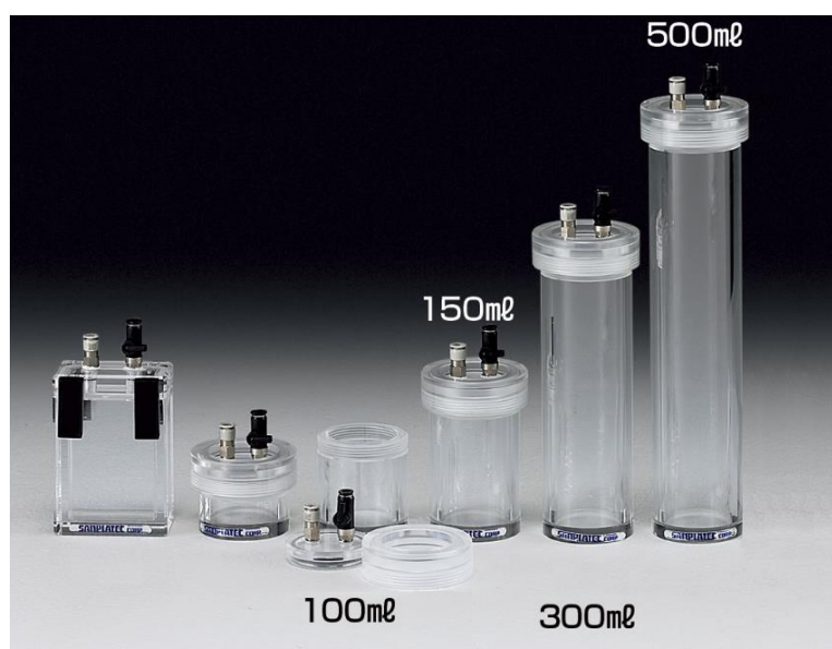
Технические характеристики портативных вакуумных эксикаторов серии «Round type» и «Square type»

Компактные и легкие эксикаторы серии «Round type» и «Square type» включают в себя цилиндрические и прямоугольные эксикаторы с объемом рабочей камеры от 50 до 500 мл. Эксикаторы предназначены для длительного или кратковременного хранения образцов, а также для транспортировки образцов или деталей в среде вакуума или инертного газа. Эксикаторы представляют собой герметичный сосуд небольшого размера, в верхней крышке которого установлен кран для подачи инертного газа и кран для откачки воздуха из рабочего пространства эксикатора. Для создания вакуума в эксикаторах рекомендуется использовать ручные вакуумные помпы с вакуумными манометрами (см. раздел принадлежности). Эксикаторы также рассчитаны на создание положительного давления в рабочем пространстве не более 10 кПа. При давлении превышающем 10 кПа в рабочем пространстве эксикатора автоматически открывается клапан превышения давления (кран откачки воздуха).